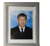
ご遺影 (大1、小2) パール額 (3.1万円)

弊社スタッフが一本一本心をこめて作成する生花祭壇。ご出棺の前にはご家族、ご会葬の皆様の手でたくさんのお花をお棺に入れてさしあげてください。