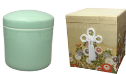
5寸青磁壺・金欄箱 (1万円)