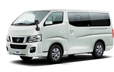
搬送車 (10kmまで) ×2回 (2.8万円)