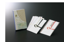
会葬品・礼状200組 (7万円)