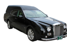
霊柩車 (10kmまで) (2.7万円)

この他：司会1名・式場係1名・音響 (6.5万円)、看板一式 (3.25万円)、ビデオ撮影 (1.5万円)、消臭剤 (8千円)、ドライアイス×2回 (1.6万円)、化粧品 (5千円)、役所手続 (8千円) / ローソクなど各種消耗品・備品 (22,560円)、会館使用料 (5万円)